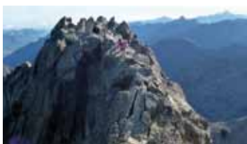
Les baroudeurs au pic du Palas