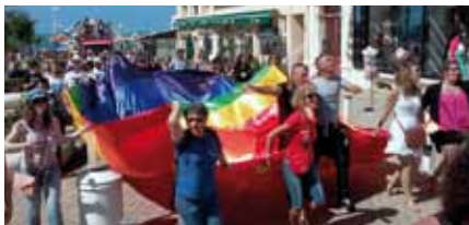
Défilé de la Lesbian & Gay Pride 2015 dans les rues de Biarritz