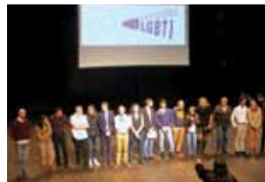
Etats généraux LGBTI à Avignon