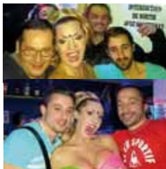
Soirée Arcolan au bar le Paupotin