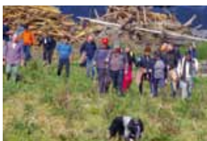
Balade en terre basque