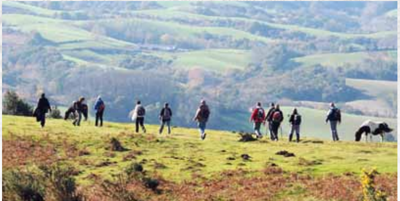
Virée entre Pays Basque et Béarn, au loin l'océan Atlantique et le sud des Landes...