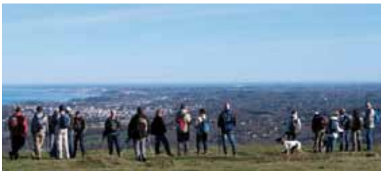
Sortie Xoldokogaina. Petite pause pour profiter pleinement de la vue...