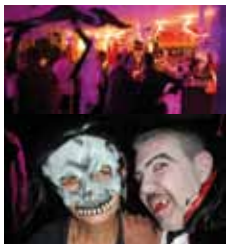
Soirée Halloween à Txalaparta