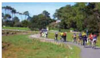
Randonnée à vélo dans les Landes